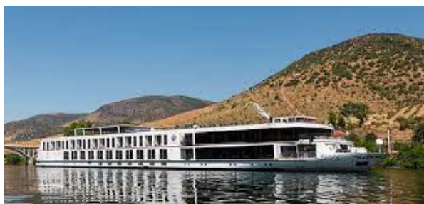
Le Queen Isabel 5***** Le plus beau bateau naviguant sur le Douro