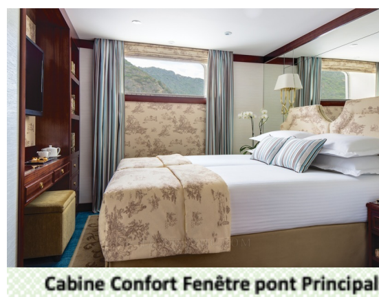
Cabine Confort Fenêtre pont Principal